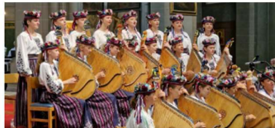
"UKRAINE BANDURA MUSIC GROUP, "DZVINGZA", (based in Lviv)